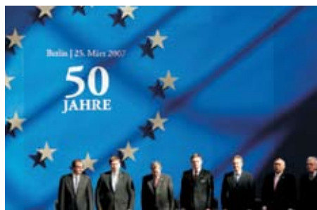
Лидеры ЕС на встрече в Берлине

Лидеры стран ЕС провели в Берлине неформальный саммит, где была подписана совместная Декларация. В ней выражено намерение «поставить Европейский Союз на обновленную совместную основу до выборов в Европейский парламент в 2009 году, придать динамику европейским процессам, новый импульс обновлению и реформированию ЕС. Европейское единство, принесшее людям мир и благосостояние, сделало реальностью мечту предыдущих поколений, и необходимо «сохранять это счастье для будущих поколений», — указывается в Берлинской Декларации.