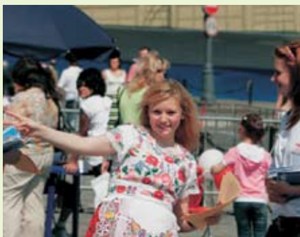
Уже четвертый год студенты Москвы считают «День Европы» своим праздником

сладостями, рассказывали о своих традициях, культуре, достопримечательностях и самых необычных туристических маршрутах. У студентов была возможность узнать из первых рук о лучших европейских университетах и стипендиях, которые предоставляются россиянам. Желающие могли разучить пару полезных фраз сразу на нескольких языках и тут же лично пообщаться с послами Европейского Союза или, заняв места в «Евроэксспрессе», совершить увлекательное видеопутешествие от Лиссабона до Хельсинки. Живые скульптуры, компьютерные игры, викторины, призы и подарки, многочасовой концертный марафон — это лишь часть насыщенной программы фестиваля, которая завершилась ярким фейерверком. А тем, кто не смог присоединиться, можно было «отправить» уникальную почтовую открытку.