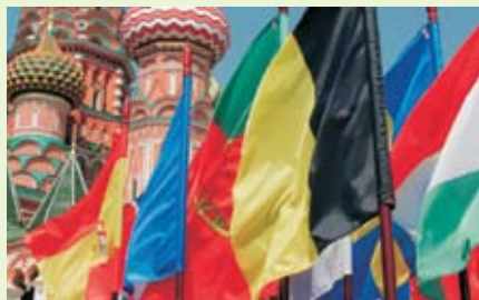
Европейские флаги на Васильевском спуске

Четвертый международный молодежный фестиваль «День Европы», организованный Представительством Европейской Комиссии в России, Московским студенческим центром, посольствами и культурными центрами стран Европейского Союза, состоялся в середине мая в столице России. Торжественная церемония открытия прошла в центре города, на главной площадке — Васильевском спуске. В ней приняли участие главы дипломатических миссий стран ЕС.