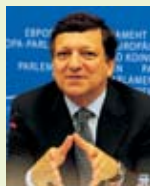
Жозе Мануэл БАРРОЗУ, Председатель Европейской Комиссии

говорились о создании зоны свободной торговли и таможенного союза. Новыми соглашениями устранялись препятствия на пути свободного передвижения людей, услуг и капиталов. Была разработана общая политика в области сельского хозяйства. Начался процесс сближения законодательств европейских государств. Это были твердые шаги в будущее новой Европы, выражение общей воли миллионов ее граждан. За 50 лет страны ЕС немало сделали для сплочения не только в экономической, но и политической и социальной сферах. Единая валюта, открытые внутренние границы, авторитет на мировой арене — всё это итог серьезной, сложной работы нескольких поколений. В этом номере «Вестника» мы вместе взглянем на путь, пройденный Европой за прошедшие полвека, проследим за тем, как строились её отношения с СССР, а также вспомним людей, ставших знаковыми фигурами в созидании единого «европейского дома». А об одном из примеров взаимодействия ЕС и России сегодня — наш репортаж из Твери.