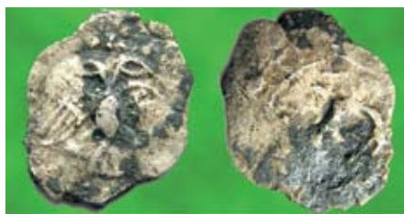
Тверская денга XV века с двуглавым орлом – историческое свидетельство финансовой самостоятельности Твери

К примеру, «сбросившись», несколько городков одного графства построили экологически чистый завод по переработке мусора. Одному городу такой проект было бы поднять не по силам. Эффективность и прозрачность бюд-