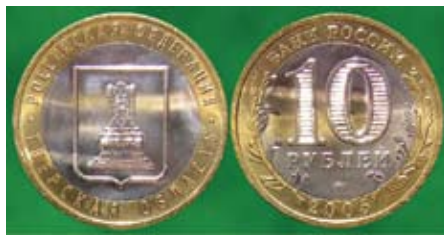
Сегодня «тверские монеты» чеканит исключительно Банк России

жетного расходования в европейских муниципалитетах, их высокий статус в управлении бюджетом в государственном масштабе – опыт, который будет взят на вооружение в Твери.